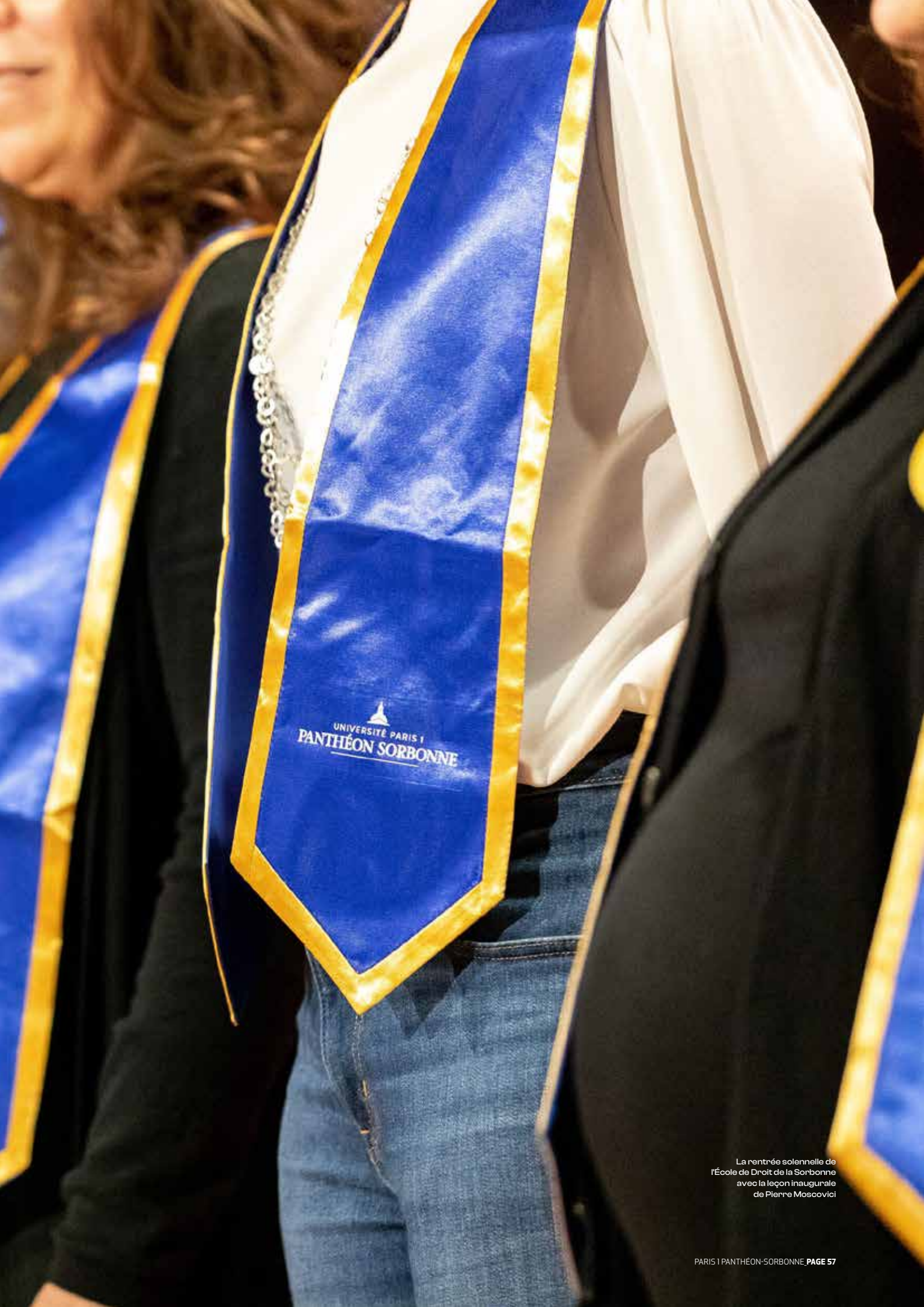
La rentrée solennelle de l'École de Droit de la Sorbonne avec la leçon inaugurale de Pierre Moscovici