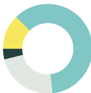
Répartition des inscriptions pour l'année 2021-2022